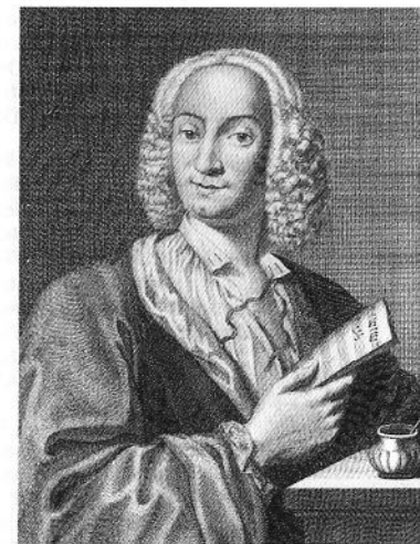
Royal College of Music